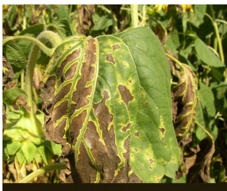
Verticillium sur tournesol :

Petites taches jaunes vives sur feuilles basses puis chlorose inter-nervaire plus ou moins large. Les tissus finissent par brunir et mourir. Les nervures restent vertes.