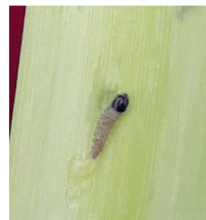
Larve de pyrales

En parcelle de référence à Mimbaste, on note la présence de 10% de plantes attaquées, avec des pontes mais aussi des larves de 8 à 10 mm.