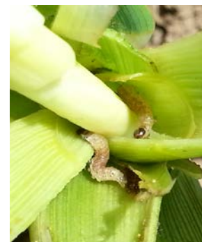
Larves de sésamies

Le début de vol de 2 ème génération devrait démarrer à partir du 7 juillet. Les dates pourraient varier en fonction des conditions climatiques.