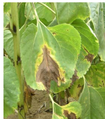
Symptômes de phomopsis sur feuille

A ce jour, on ne signale toujours pas de symptôme sur le territoire.