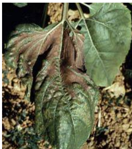
Carence en bore sur tournesol :

Petites taches jaunes vives sur feuilles basses puis chlorose inter-nervaire plus ou moins large. Les tissus finissent par brunir et mourir. Les nervures restent vertes.