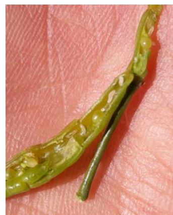
Larves de cécidomyies suite à des piqûres de Charançon des siliques

Les parcelles vont progressivement sortir de la période de risque et le ravageur n'est plus observé dans les parcelles.