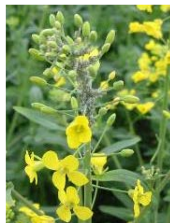
Manchon de pucerons cendrés

Attention : colonie ne veut pas dire manchon ! Les colonies sont constituées au départ d'amas de quelques pucerons (≈10) qui nécessitent un minimum d'attention pour être repérées.