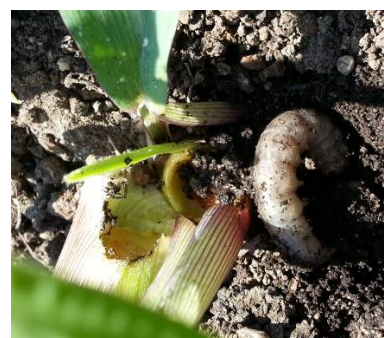
Vers Gris Photo Ph. Mouquot CA33

Piégeage : concernant Agrotis Segetum (sédentaires), le réseau de piégeage a enregistré des captures dans 3 pièges sur 6 sur les secteurs Nord33 Entre deux mers, Nord 47-24 et Sables des Landes. 3 pièges sur 8 relevés ont capturé des Agrotis Ipsilon sur les secteurs du Nord33 entre deux mers, le Sud Adour et Gaves.