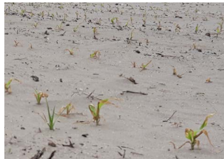
Dégâts de vent de sable

Un temps plus calme et des températures qui remontent sont attendus pour le début de la semaine prochaine en nord Aquitaine. Dans le Sud, les températures resteront plutôt fraîches pour la saison et de nouvelles précipitations sont attendues.