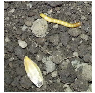
Larve de Taupins près d'un grain d'orge

Sur la commune de Bergerac on nous signale une parcelle dont l'attaque se situe entre 15 et 20 %.