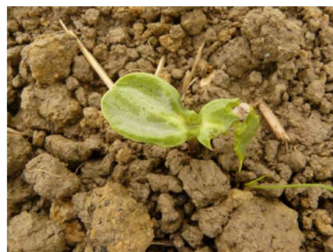
Dégâts de limace sur jeune pied de tournesol

Bien prendre en compte la présence de résidus en surface (de culture, de couverts végétaux, liés au salissement) et la structure du sol dans l'analyse du risque. Soyez vigilants jusqu'au stade B4 (seconde paire de feuille).