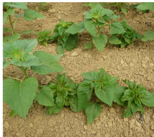
Symptômes de mildiou sur tournesol

https://www.terresinovia.fr/-/maladies-du-tournesol-diagnostiquer-les-symptomes-foliaires?p_r_p_categoryId=130441&p_r_p_tag=69906&p_r_p_tags=281245