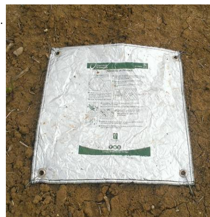
Piège limace De Sangosse

Il est encore possible d'installer le piège à limaces (bâche de 50 cm sur 50 cm) sur votre parcelle préparée ou semée afin de vérifier la présence de limaces.