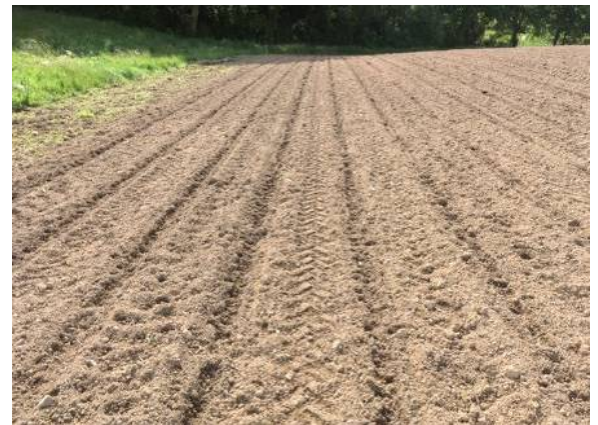
Dégâts de sangliers sur l'ensemble des rangs

A Saint Palais (64), on nous signale des corneilles ayant occasionnées des dégâts de 5 à 15 % dans plusieurs parcelles.