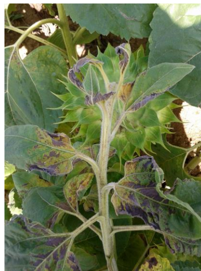
Carence en bore sur tournesol

Carence en bore : Gaufrage puis décoloration de la feuille et grillure sèche de la base du limbe (zones inter-nervaires, côté pétioles).