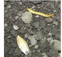
Larve de Taupins près d'un grain d'orge

La parcelle de Mimbaste (40) est touchée à hauteur de 5 %. Des attaques dans les sables sont également signalées à Souprosse.