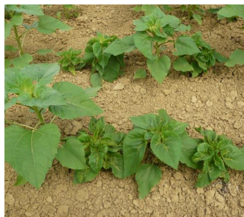
Symptômes de mildiou sur tournesol (Photo : Terres Inovia)

https://www.terresinovia.fr/-/maladies-du-tournesol-diagnostiquer-les-symptomes-foliaires?p_r_p_categoryId=130441&p_r_p_tag=69906&p_r_p_tags=281245