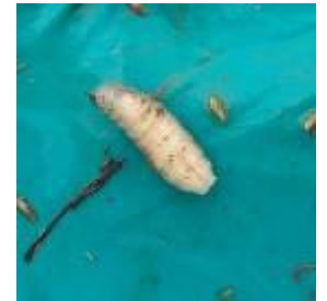
Larve de la mouche des semis

Le retour de la chaleur permettrait aux maïs de pousser plus rapidement et donc de limiter la pression du ravageur.